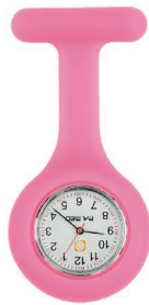
● ROSA - Ref: REL002 EAN: 7898523735812