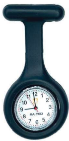
● PRETO - Ref: REL001 EAN: 7898523735805