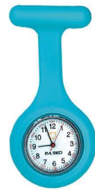
● AZUL CLARO - Ref: REL009 EAN: 7898523737533