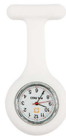
○ BRANCO - Ref: REL007 EAN: 7898523735867